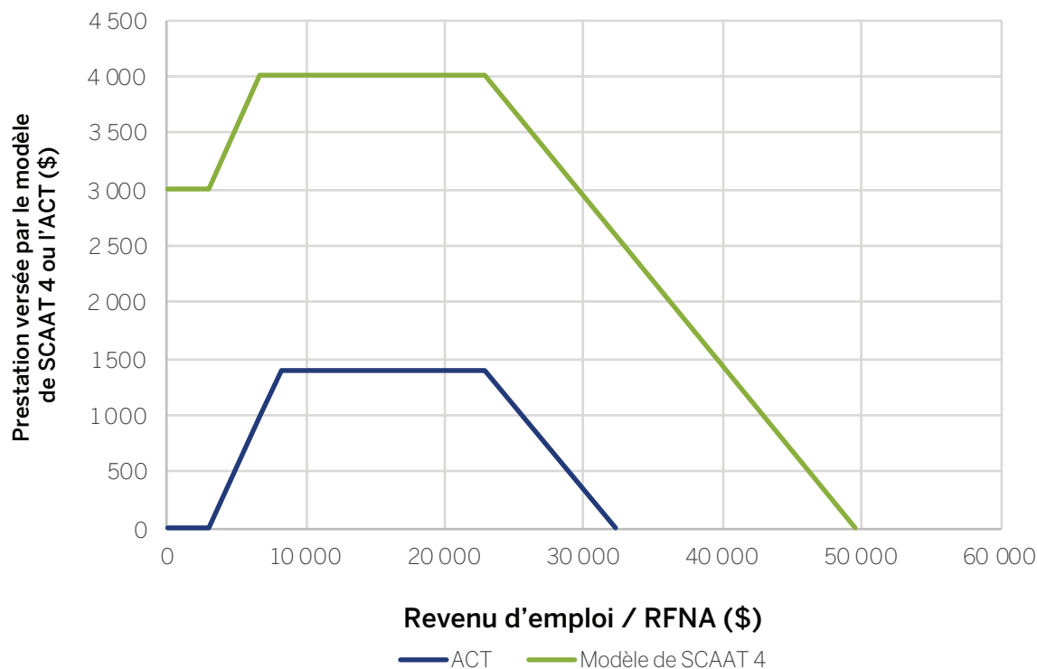
Figure 2: Comparaison des montants de base versés par l'ACT et le SCAAT